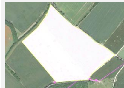
Окресліть контури поля