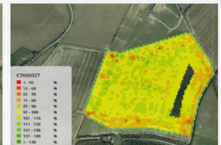
Урожайність – інтерпольована карта