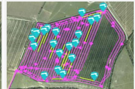
Подія "Розвантаження бункера"